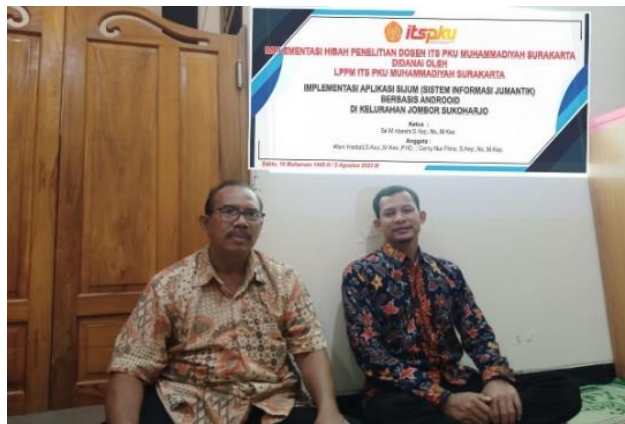
Gambar 1. Pemberian Informasi dan Edukasi