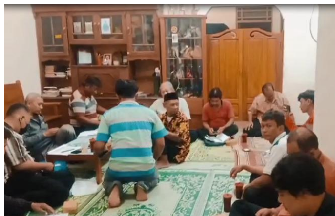
Gambar 3: Warga Gabusan Jombor Sukoharjo

Pengukuran menggunakan kuesioner dilakukan dua minggu setelah pemberian informasi dan edukasi SIJUM untuk mengukur pelaksanaan jumantik mandiri warga Gabusan Jombor Sukoharjo. Berikut adalah hasil pengukuran tersebut: