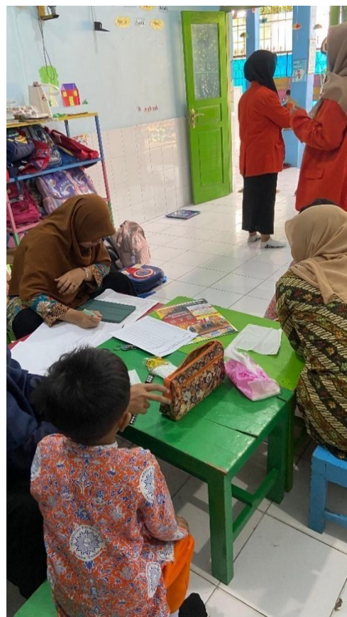
Gambar 3. Pendokumentasian hasil screening siswa TK Aisyiyah 1 Kadipiro