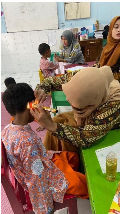
Gambar 2. Pelayanan kesehatan oleh tim dosen ITS PKU Muhammadiyah Surakarta

Adapun dokumentasi kegiatan pemeriksaan kesehatan di TK Aisyiyah Kadipiro 1 Surakarta seperti terlihat pada Gambar 2-4.