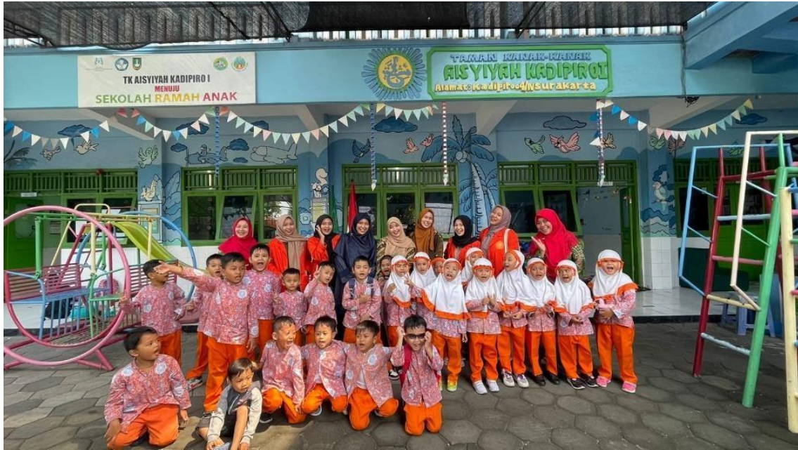
Gambar 4. Foto bersama usai kegiatan